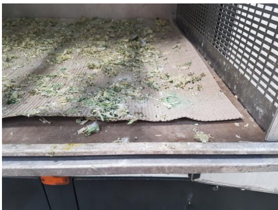
TE WEINIG KARTON

Er mag heel zuinig (een klein handje) gebruik worden gemaakt van hennepvezel of houtmot. Te veel bodembedekking is niet wenselijk. Omdat zand en korrels enorm kunnen stuiven, mag hier beslist geen gebruik van gemaakt worden.